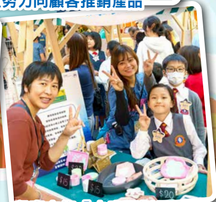
兒童市集「水磨石製品」的小館長們