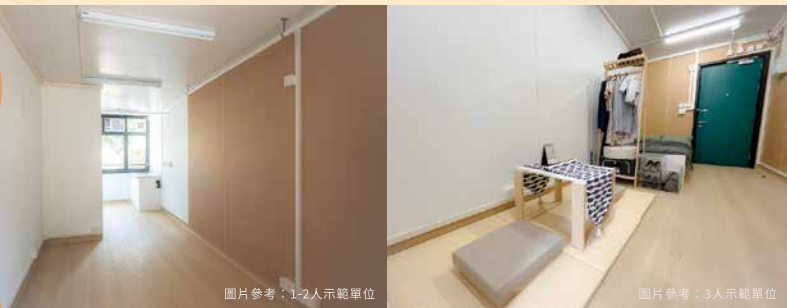
圖片參考：1-2人示範單位