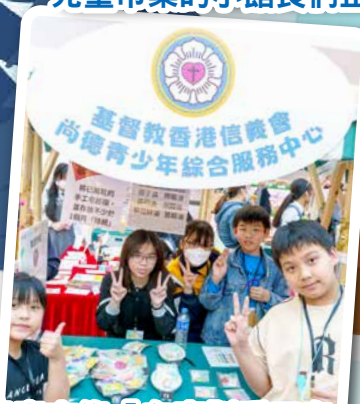
兒童市集「自家製手工皂」的小館長們