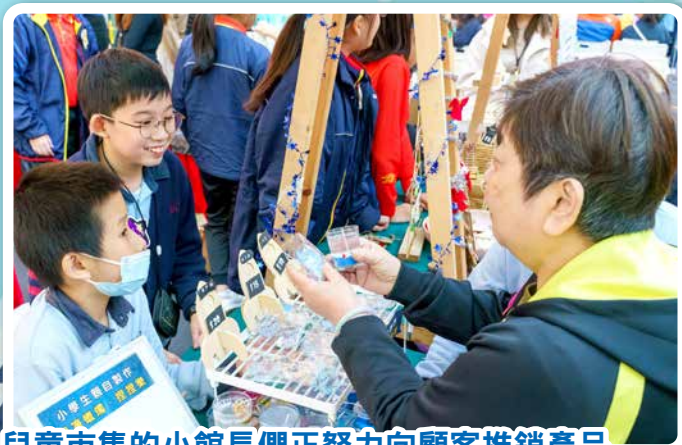
兒童市集的小館長們正努力向顧客推銷產品