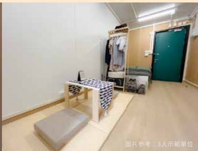
圖片參考：3人示範單位

共提供 1,080 個單位，包括 1-2人、3人、4人 單位 面積由 172-355 平方呎，租金由 $2,100 起 單位均備獨立煮食空間、洗手間、浴室、廚櫃