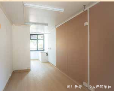
圖片參考：1-2人示範單位