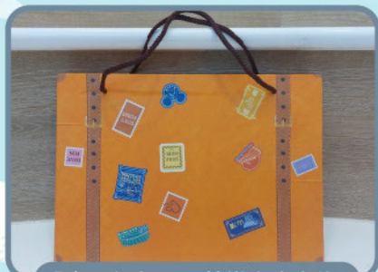
「喜·程」21天快樂家庭之旅