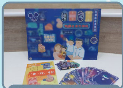
「親子好去處」磁石貼連背景板及底座、「喜·程」任務卡、「喜·程」手記