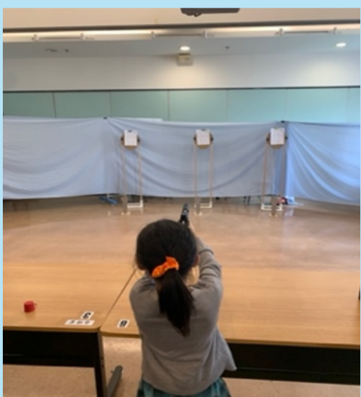
國際實用射擊協會(IPSC)實用射擊訓練